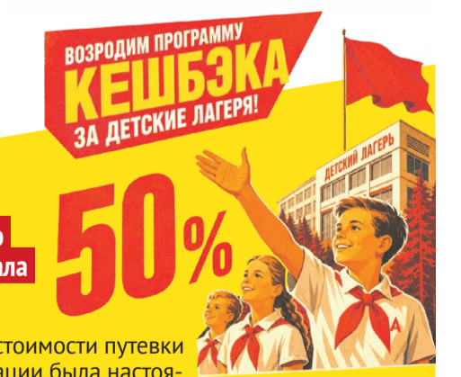
Возродим программу КЕШБЭКА ЗА ДЕТСКИЕ ЛАГЕРЯ! 50% Иллюстрация: Алексей Беленев

Рекомендации депутатов СПРАВЕДЛИВОЙ РОССИИ по итогам проведенной оценки системы летнего отдыха детей были проигнорированы правительством. Необходимо вернуть власть лицом к детям. Без этого никакого разговора об улучшении демографической ситуации вести нельзя. Пришло время переломить ситуацию!»