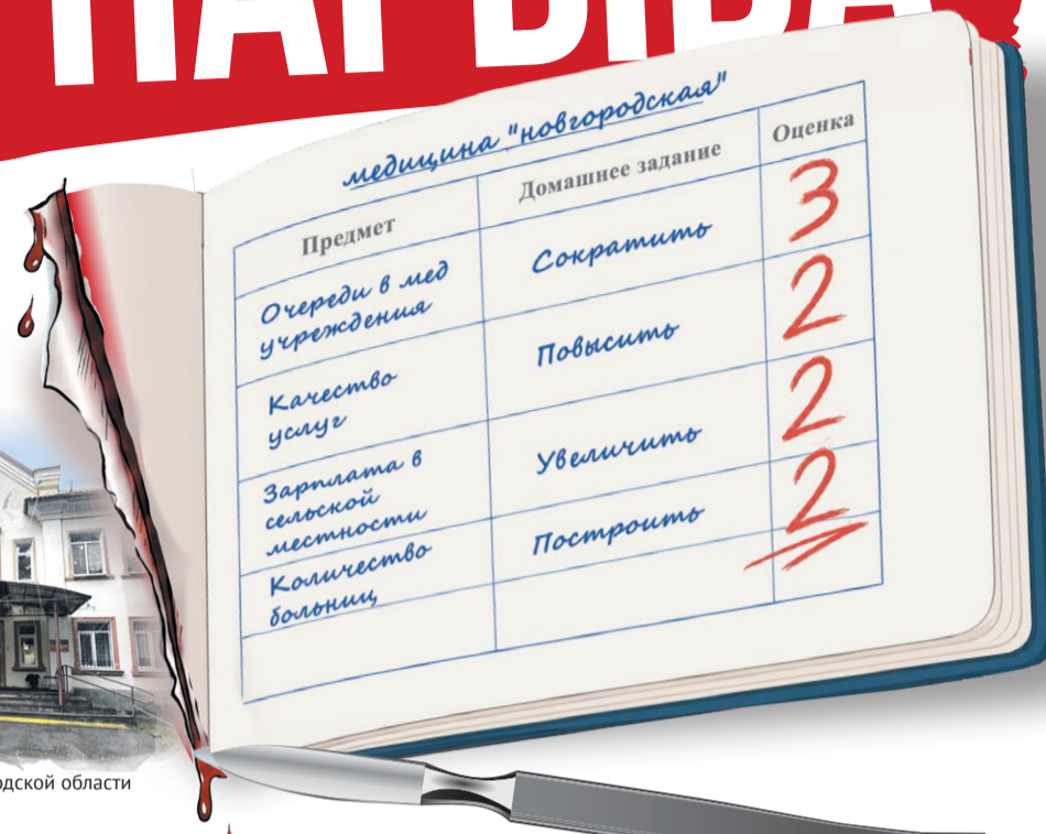
Иллюстрация: Елена Миронова