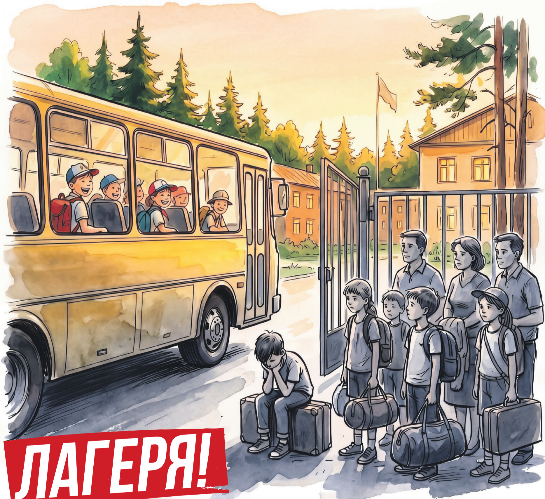
Иллюстрация: Елена Пантелеева