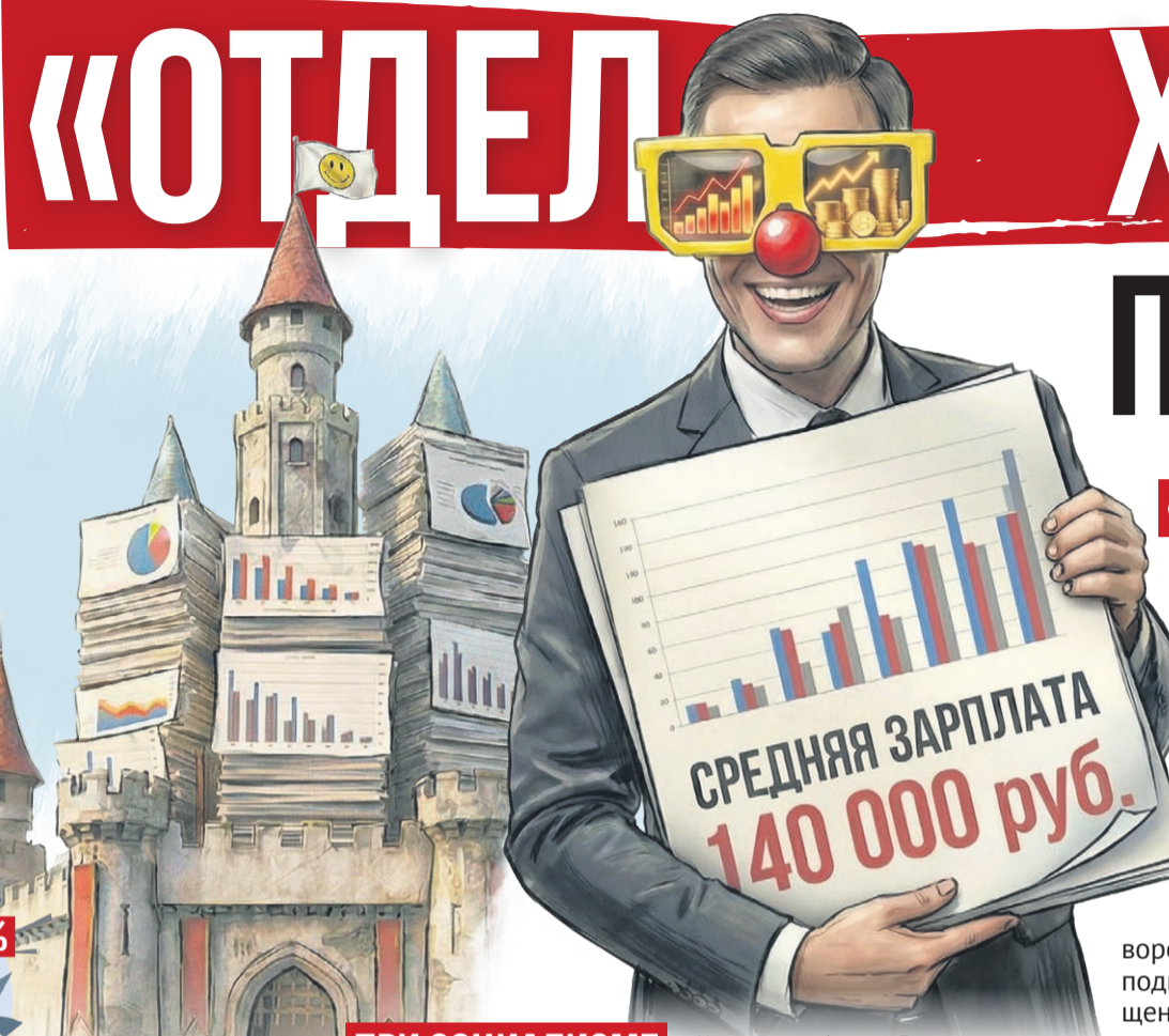
Иллюстрация: Алексей Беленев