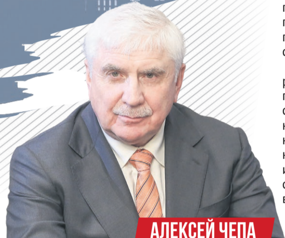
АЛЕКСЕЙ ЧЕПА

АЛЕКСЕЙ ЧЕПА, депутат Государственной Думы от Партии СПРАВЕДЛИВАЯ РОССИЯ: