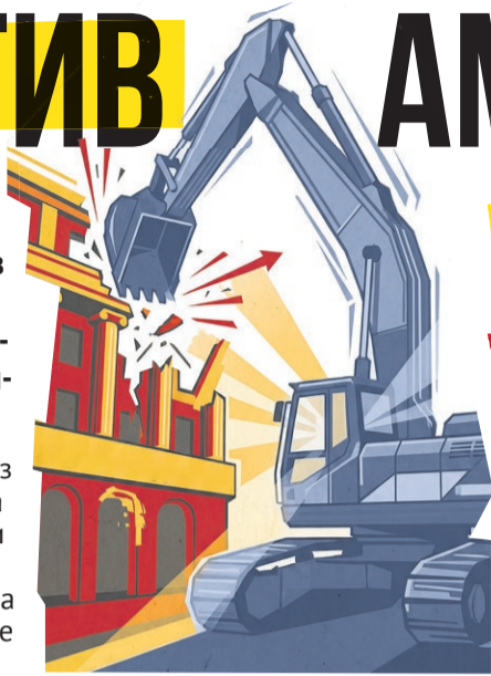
Иллюстрация: Алексей Беленёв