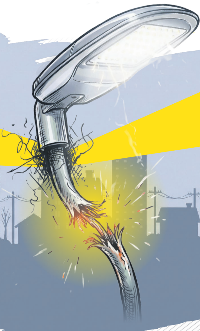
Иллюстрация: Алексей Беленёв

ОБЩАЯ ПРОТЯЖЕННОСТЬ ЛЭП В РЕГИОНЕ ~24 000 км