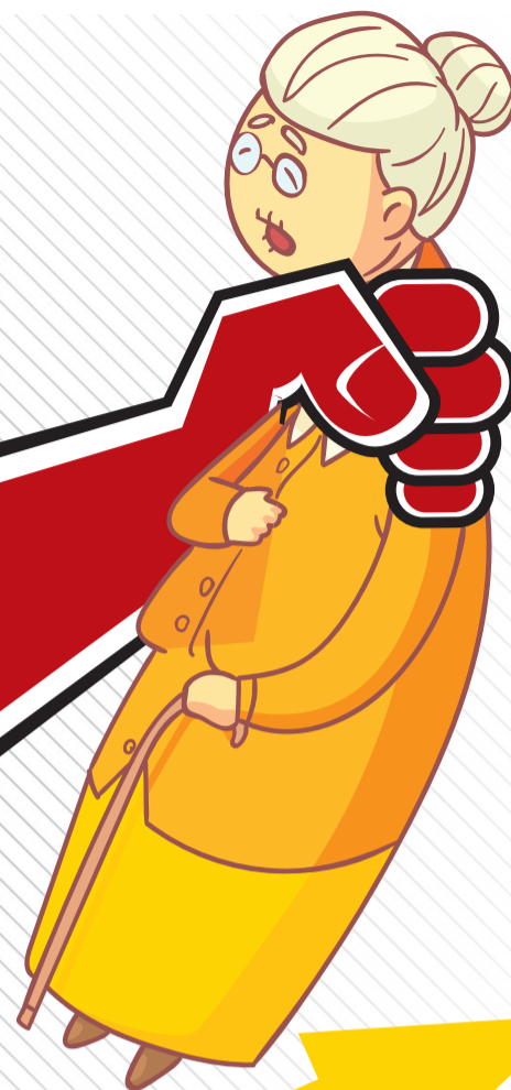
Иллюстрация: 123rf.com, коллаж: Пантелеева Елена

Так что же входит в состав коммунальных ресурсов, подлежащих обязательной оплате за СОИ? Это холодная и горячая вода, электрическая энергия, а также отведение сточных вод (канализация).