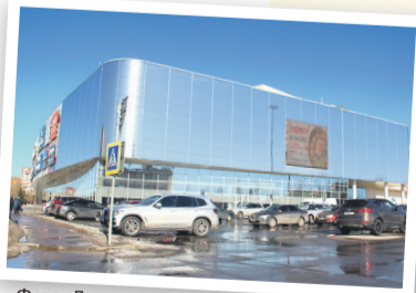
Фото: Людмила Лиукконен

Излюбленное место встреч новгородской молодежи – торговый центр «Мармелад». Здесь с завидной регулярностью происходят драки. Безусловно, каждую из ситуаций полицейские разбирают по горячим следам, бдительность охранников ТЦ на время усиливается... до следующего ЧП.